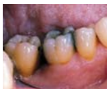
Карієс 14% (1)