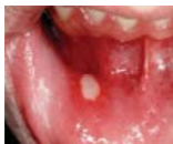
Виразки 34,7% (1)