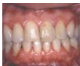
Запалення ясен 40,4% (1)