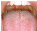
Неприємний запах 19% (1)